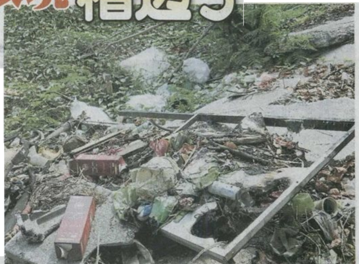
地方政府早前设立的照顾环境觉醒牌, 也遭人拆下烧掉。

面积约3亩的峇南湖在2008年之前进行第一期美化工程后, 就没有再继续美化与提升, 维修工作也不理想, 居民也怀疑, 湖中的餐馆将污水排到湖中。