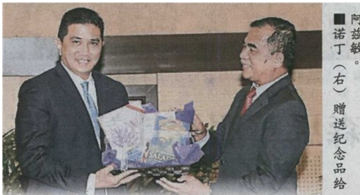
■ 阿兹敏（右）赠送纪念品给