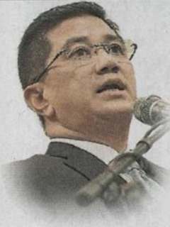
■阿兹敏：州政府尝试寻找更多能增加收入的来源。