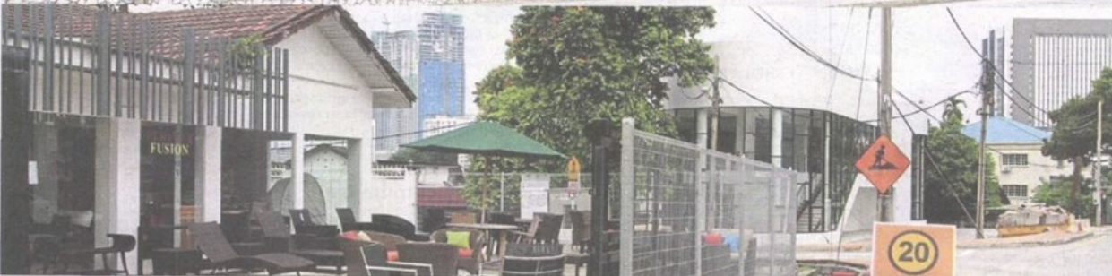
New status: (From top) Houses in Jalan Universiti, Jalan Dato Abu Bakar and Jalan Kemajuan in Petaling Jaya are among the 633 units that have been rezoned from residential to limited commercial.