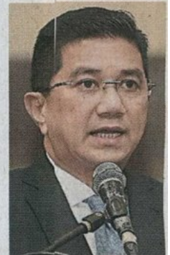
▲阿兹敏：雪州政府将从多方面进行开源，不再一味依靠土地作雪州收入来源。

出席者包括雪州财政司拿督诺丁、雪州秘书拿督莫哈末阿敏、雪州高级行政议员拿督邓章钦、州行政议员聂纳兹米、欧阳捍华、阿米鲁丁、再迪阿都塔利、斯里安达拉斯区州议员艾斯尔再也、经济专才、学者及各工业代表。