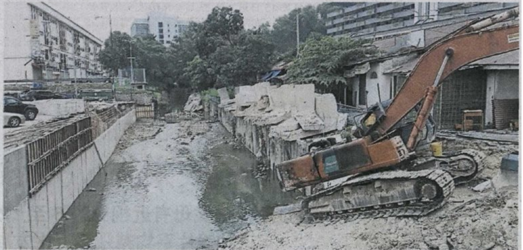
加影直鲁河位于加影巴刹旁及小贩摊档部分的河道加宽工程已开始施工。

加影市区过去屡遭洪流袭击, 逢大雨时看到河水暴涨的商家总忍不住捏冷汗。雪州大臣拿督斯里阿兹敏阿里于 2014