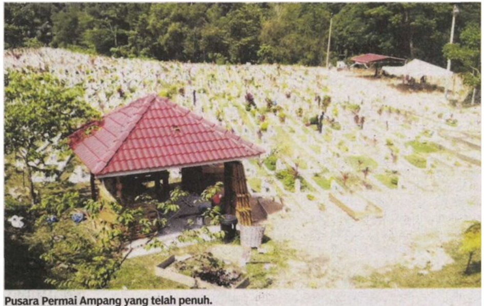
Pusara Permai Ampang yang telah penuh.

Beliau berkata, pihaknya dimaklumkan MPAJ dalam perancangan memohon kepada kerajaan negeri untuk menggazet 20.8 hektar