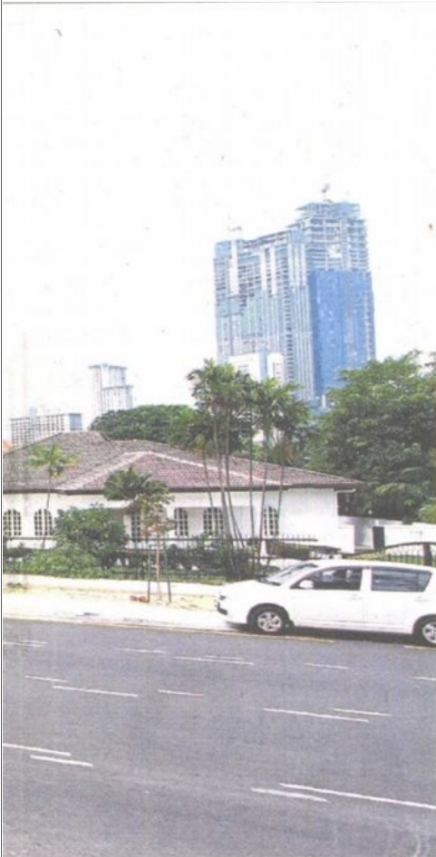
1 Jalan Utara in Section 52 has been rezoned from residential to limited commercial.

Provided for client's internal research purposes only. May not be further copied, distributed, sold or published in any form without the prior consent of the copyright owner.