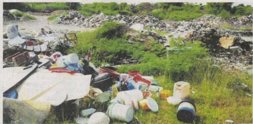
Sampah dilonggok tinggi sebelum dibakar pihak tidak bertanggungjawab menyebabkan penduduk sekitar mendakwa kesihatan mereka merosot.

"Saya nak minta beliau lihat sendiri masalah ini... jika pejabat tanah tidak boleh selesaikan masalah, saya cadang tanah milik kerajaan negeri diserahkan kepada MPSJ supaya pihak itu tahu apa perlu dibuat," katanya.