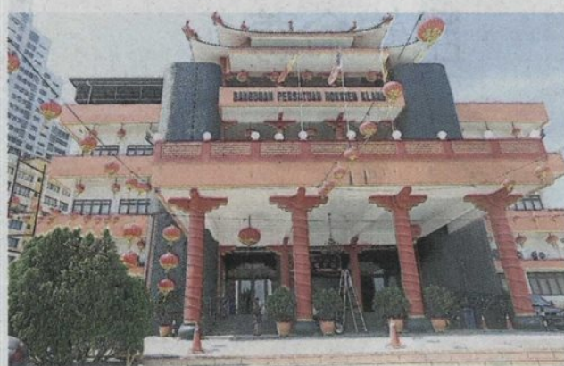
巴生福建会馆迎来112周年庆。

- 创作一首巴生福建会馆的会歌；编曲已有眉目，也会物色合适人选填词，为会馆量身定做一首属于全体会员的会歌。