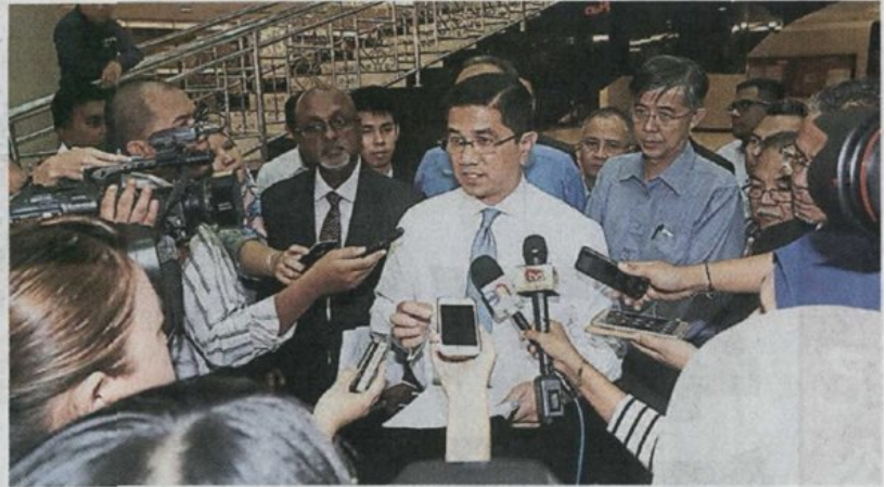
■阿兹敏阿里(中)告诉媒体,除了继续在国会下议院争取公开一个马来西亚发展公司稽查报告,也希望依循法律管道强制谕令纳吉和政府等三造公开报告;左为公正党梳邦区国会议员西华拉沙,右为峇都区国会议员蔡添强。

他要求高庭强制谕令纳吉等三造,根据《1972年官方机密法令》2C条文,即刻公开报告,并开放给公众浏览。(LMY)