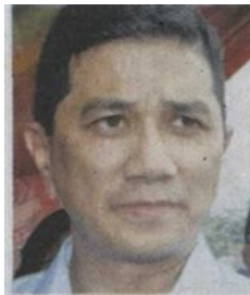
MOHAMED AZMIN ALI

Malaysia sebagai responden pertama hingga ketiga.